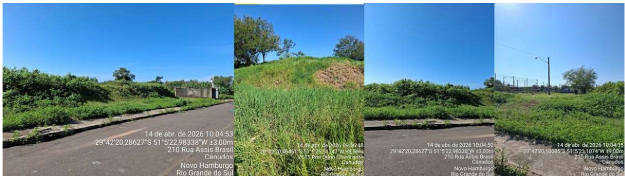
Figura 2 – Registro da Área

Outro ponto a destacar é a presença de pontos de disposição irregular de resíduos urbanos em pontos ao longo da via. A Figura 3 apresenta registro fotográfico de pontos viciados de disposição de resíduos sólidos urbanos.