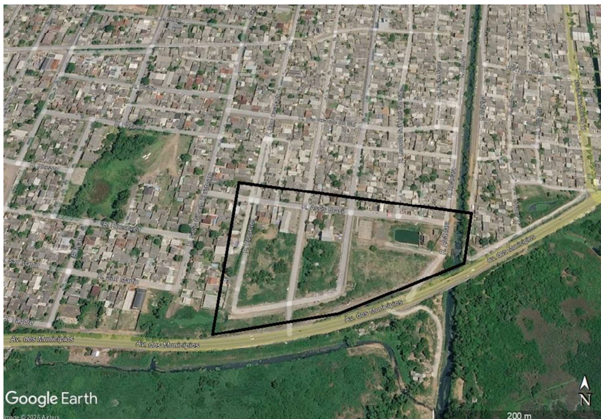
Figura 1 – Localização da área

Conforme pode ser observado na Figura 1, a área objeto da presente investigação está delimitada entre a Rua Assis Brasil, a Avenida dos Municípios, a Rua Roosevelt e a Rua Alcântara, na Vila Kipling. A seguir, é exposto o relato apresentado pelos membros do executivo municipal sobre o histórico do local. Destaca-se que todas as informações se originaram das informações fornecidas pela prefeitura municipal.