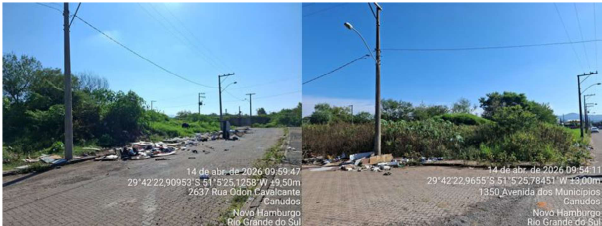
Figura 3 – Pontos de disposição irregular

Destaca-se que estes pontos viciados de descarte irregular não constituem materiais utilizados no aterramento da área, pois estão sendo depositados sobre o pavimento da via.