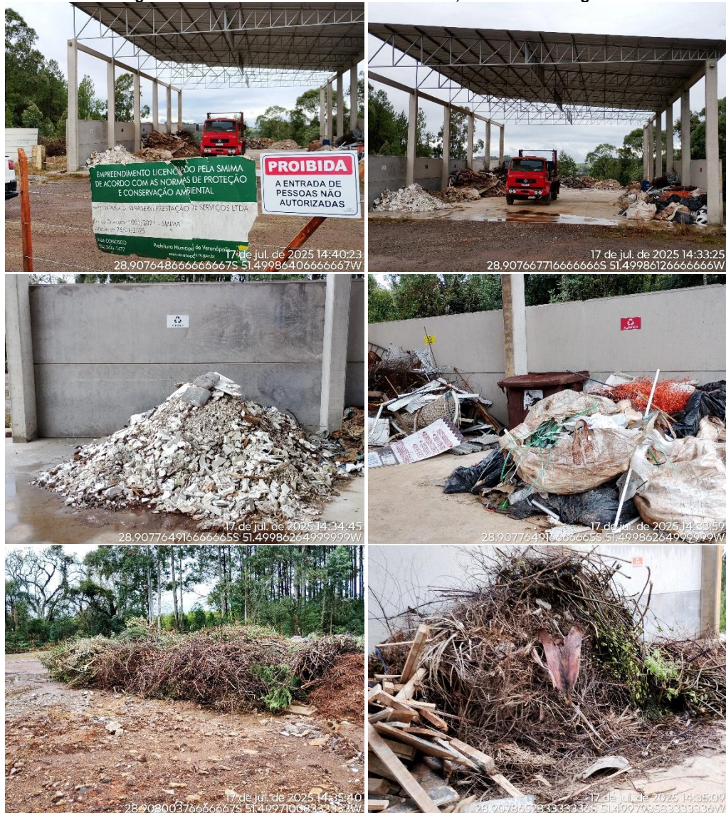
Figura 3: Aterro de RSCC com beneficiamento, com ou sem triagem

Com relação à área utilizada em 2024 como armazenamento temporário de galharia, verificou-se que a mesma não vem mais sendo utilizada pelo prestador de serviços e que o material foi praticamente todo removido, restando apenas vegetação em decomposição (Figura 4).