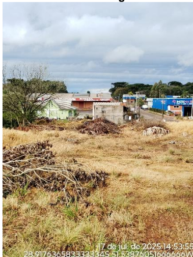
Figura 4: Área de descarte irregular utilizada em 2024