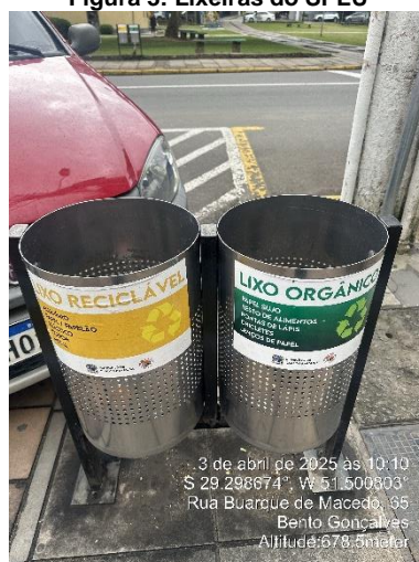
Figura 3: Lixeiras do SPLU

Durante a fiscalização, observou-se que as lixeiras públicas se encontram em bom estado de manutenção, e possuem etiquetas de identificação nas laterais (Figura 3).