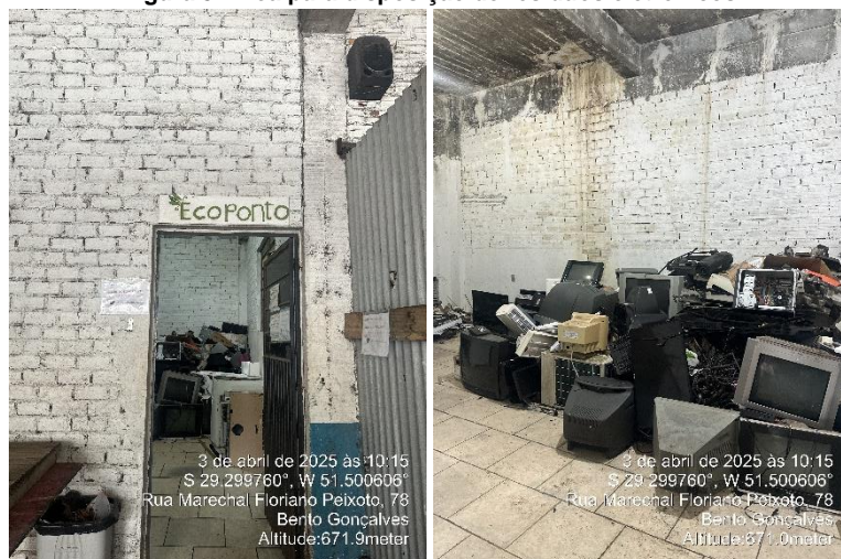
Figura 5: Área para disposição de resíduos eletrônicos

em um ponto definido pela prefeitura um dia antes da coleta, que é realizada pela empresa Ambe Gerenciamento de Resíduos (Figura 5).