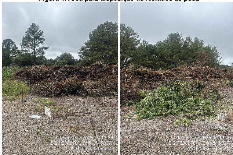
Figura 4: Área para disposição de resíduos de poda

Mediante agendamento prévio na Secretaria de Planejamento, Serviços e Vias Urbanas, os resíduos são coletados e transportados até a unidade de disposição final. O município possui um triturador móvel, que de tempos em tempos tritura a galharia e, o material gerado pode ser retirado por usuários para uso pessoal ou utilizado pela prefeitura municipal. Além disso, caso haja interesse do munícipe, o triturador pode ser utilizado na rua de sua residência.