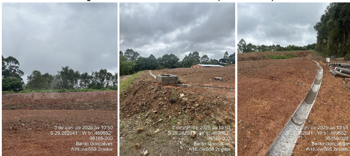
Figura 6: Área de monitoramento ambiental (aterro encerrado)

O município de Carlos Barbosa possui um aterro controlado desativado que se encontra em obras. Atualmente, o aterro está em fase de monitoramento e acompanhamento, sendo o chorume gerado recirculado na própria célula. A unidade foi fiscalizada e apresenta boas condições de manutenção (Figura 6).