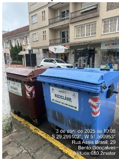
Figura 2: Containers utilizados para o acondicionamento de resíduos

O processo de coleta é realizado por equipes compostas por três colaboradores cada: um motorista e dois coletores. Cabe destacar que desde 2024 está vigente a NR 38, que estabelece os requisitos e as medidas de prevenção para garantir as condições de segurança e saúde dos trabalhadores nas atividades de limpeza urbana e manejo de resíduos sólidos. O item 38.6 da norma citada traz especificações a serem adotadas quando da execução do serviço de coleta dos RSU, visando a segurança dos trabalhadores. Sugere-se que o próximo contrato firmado entre a prefeitura e a prestadora de serviços preveja que as atividades sejam executadas de acordo com o que