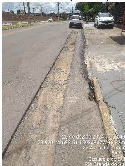
Figura 1 - Ausência de repavimentação na via.