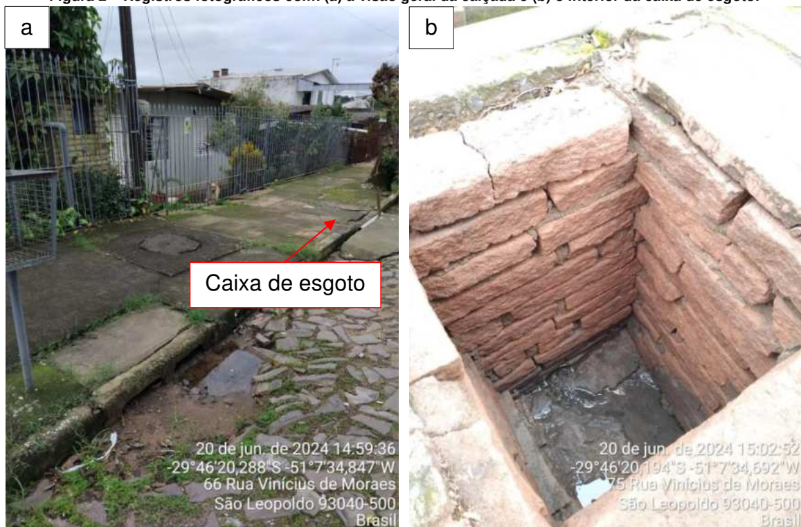
Figura 2 – Registros fotográficos com: (a) a visão geral da calçada e (b) o interior da caixa de esgoto.

A equipe de fiscalização abriu a tampa da caixa de calçada e verificou que não havia esgoto doméstico acumulado nesta. Além disso, o usuário afirmou que um grupo de técnicos do Semaes esteve no local há alguns dias para verificar a situação. Desta forma, após realizar a investigação da situação constatou que havia uma obstrução na rede de esgotamento sanitário, especificamente, na Rua Alvares de Azevedo. Os operadores do Semaes realizaram a desobstrução da rede de esgotamento sanitário, o que proporcionou o escoamento do esgoto presente na caixa de calçada.