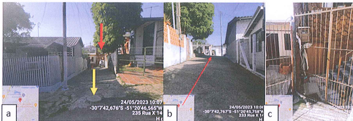
Figura 2 – Registro fotográfico da evidência de caixa de ligação: a) Vista geral do início da rua onde fica localizada a caixa de ligação e residência; b) Vista do caimento da rua até a residência; c) Vista da parte frontal do imóvel;