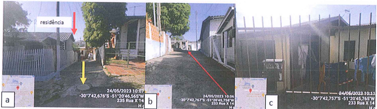
Figura 2 – Registro fotográfico da evidência de caixa de ligação: a) Vista geral do início da rua onde fica localizada a caixa de ligação e residência; b) Vista do caimento da rua até a residência; c) Vista da parte frontal do imóvel;