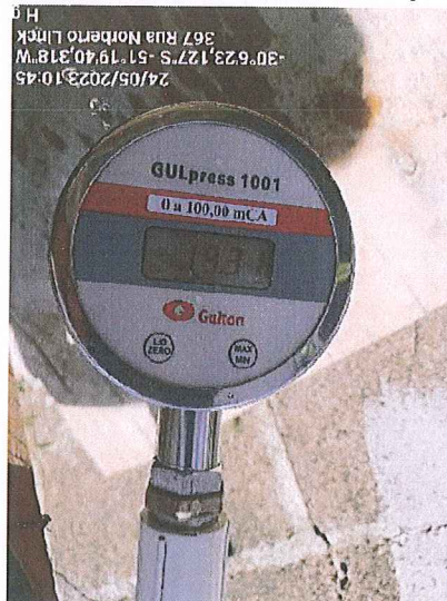
Figura 2 - Registro fotográfico medição de pressão realizada.

2. A fiscalização permitiu concluir que os valores da pressão na residência e nas proximidades estavam acima de 10 mca, desta forma atendem o limite mínimo recomendado pela norma técnica.