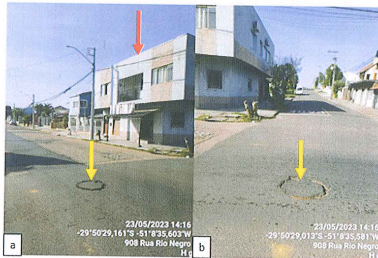
Figura 2 – Registro fotográfico do poço de visita da rede de esgotamento sanitário: a) Vista do imóvel em relação à posição do poço de visita; b) Vista da rua lateral do imóvel em relação à posição do poço de visita

2. O imóvel fica localizado próximo a um poço de visita da rede de esgotamento sanitário. No dia da fiscalização verificou-se que não havia nenhum odor proveniente da rede de esgotamento sanitário e estava operando corretamente.