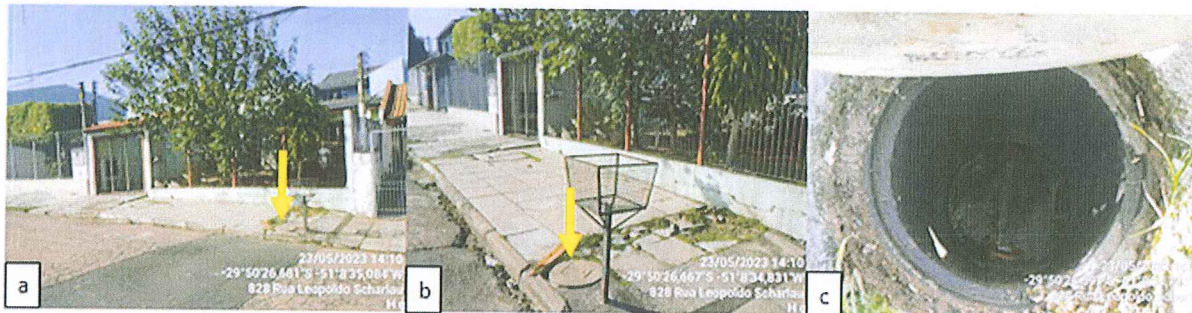
Figura 2 – Registro fotográfico da evidência de caixa de ligação: a) Vista frontal do imóvel; b) Vista geral do imóvel com o posicionamento da caixa de ligação; c) Vista interna da caixa de ligação, desobstruída.

2. Na fiscalização verificou-se que a casa está situada em uma cota superior à calçada e à caixa de ligação da rede de esgotamento sanitário. Isso permite inferir que em condições normais não há ocorrência de retorno de esgoto para a residência. Também foi possível verificar que no momento da fiscalização a caixa de passagem de esgoto estava totalmente desobstruída.