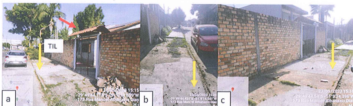
Figura 2 – Registro fotográfico do imóvel e Tubo de Inspeção e Limpeza (TIL): a) Vista da frente do imóvel e posicionamento do TIL; b) Vista do TIL localizado em frente à residência; c) Vista do posicionamento do TIL no calçamento em frente ao imóvel.

2. A fiscalização permitiu concluir que a rede domiciliar de esgotamento sanitário fica localizada em uma cota passível de ligação ao TIL localizado na rua Manoel Atanázio Dias, n. 192, pois aparentemente não há um desnível do terreno que impeça a ligação.