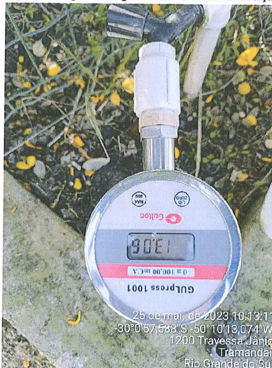
Figura 2 – Registro fotográfico do momento da medição