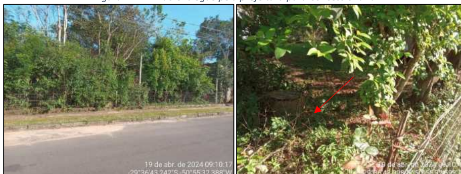
Figura 1 - ETE não entregue pela prefeitura para Concessionária

Importante ressaltar que a Concessionária não recebeu a ETE em questão e nem mesmo o cadastro das redes em operação do Poder Concedente, como acima informado, o que tem imposto significativa dificuldade nas atividades da Concessionária. Inclusive, foi solicitado ao Poder Concedente que tome as providências a fim de regularizar a situação junto à Araricá Saneamento.