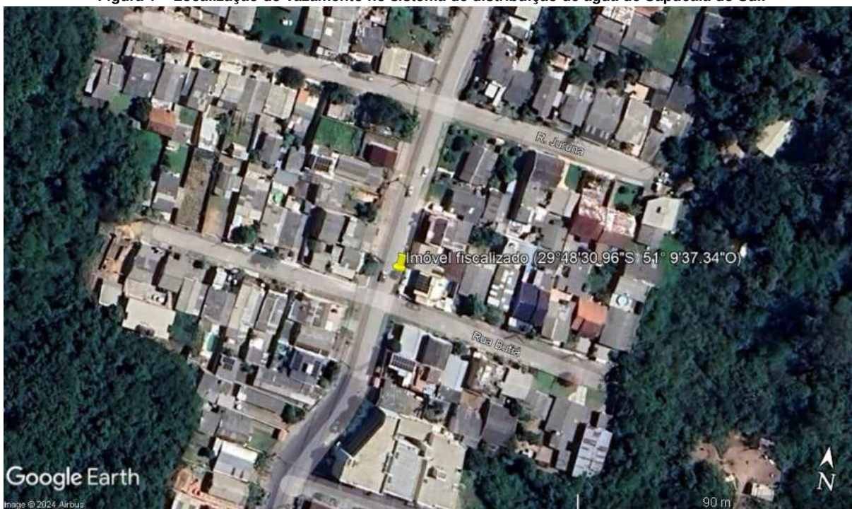
Figura 1 – Localização do vazamento no sistema de distribuição de água de Sapucaia do Sul.