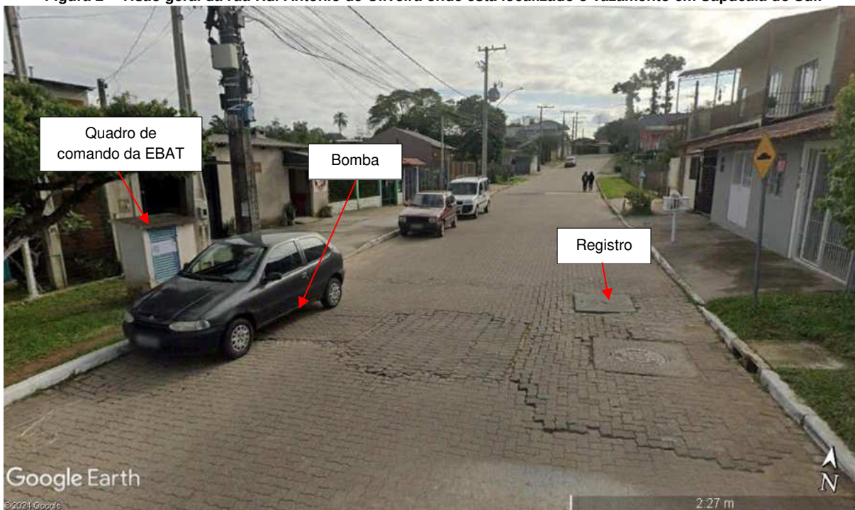
Figura 2 – Visão geral da rua Rui Antônio de Oliveira onde está localizado o vazamento em Sapucaia do Sul.