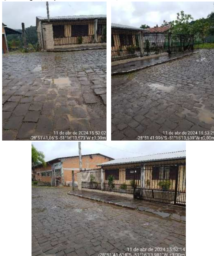
Figura 2 – Poças de água, de provável vazamento, na rua Laurindo Zanotto em Antônio Prado.