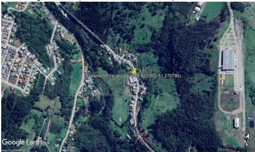
Figura 1 – Localização do vazamento na rede de distribuição de Antônio Prado.