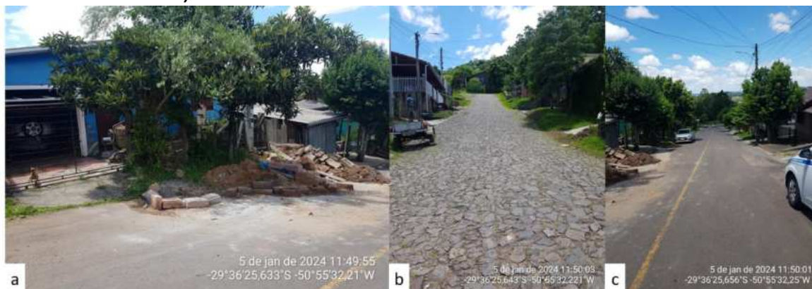
Figura 2 – Registro fotográfico da residência: a) Vista frontal da residência; b) Vista da via sem Poço de Visita (cotas superiores à residência); c) Vista da via sem Poço de Visita (cotas inferiores à residência).