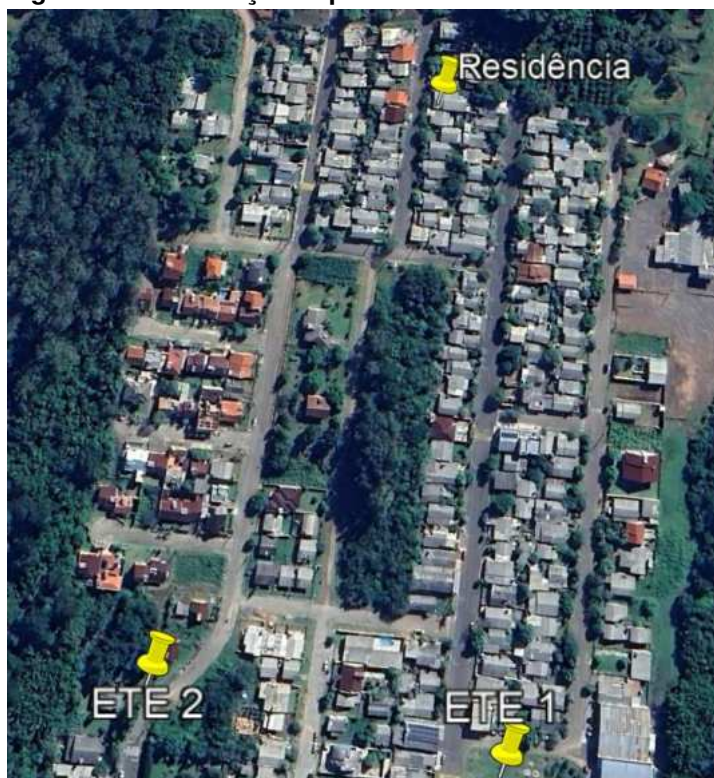
Figura 1 – Localização especial das ETE e da residência.

A seguir, faz-se a verificação da existência de coleta/afastamento de esgoto na residência. A figura 2 apresenta o registro fotográfico da residência.