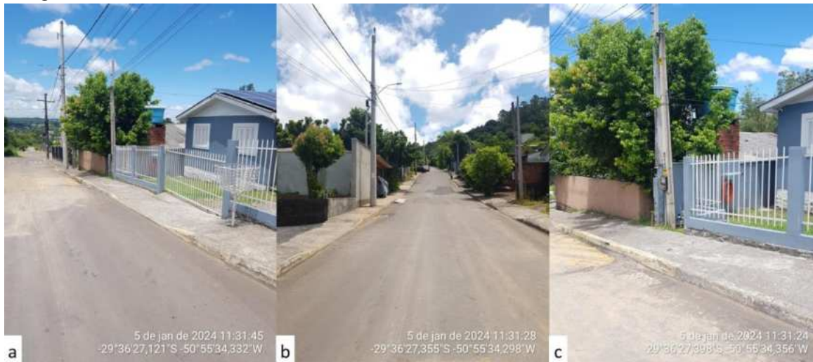
Figura 2 – Registro fotográfico da residência: a) Vista frontal da residência; b) Vista da via sem poço de visita; c) Vista da calçada da residência com tampa da caixa de passagem da rede de drenagem.