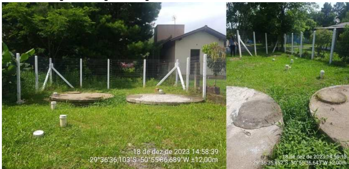
Figura 4 – Registro fotográfico da ETE da Av. Martim F. Rascke.