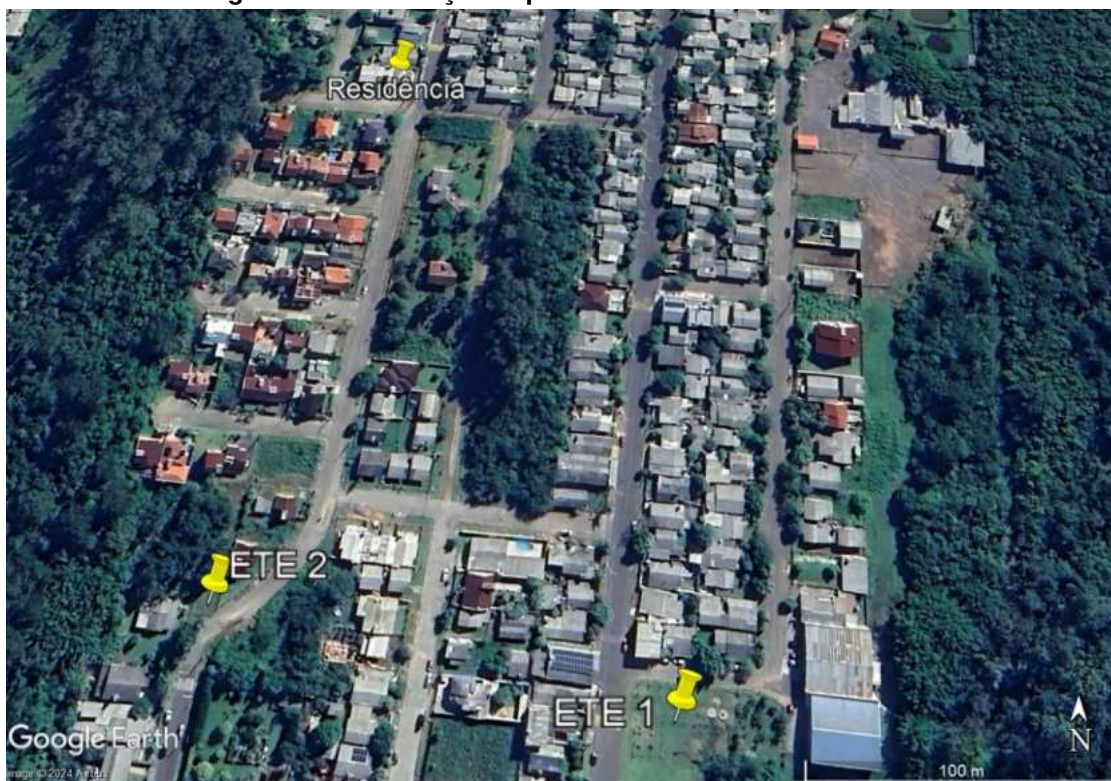
Figura 1 – Localização especial das ETE e da residência.

A seguir, faz-se a verificação da existência de coleta/afastamento de esgoto na residência. A figura 2 apresenta o registro fotográfico da residência.