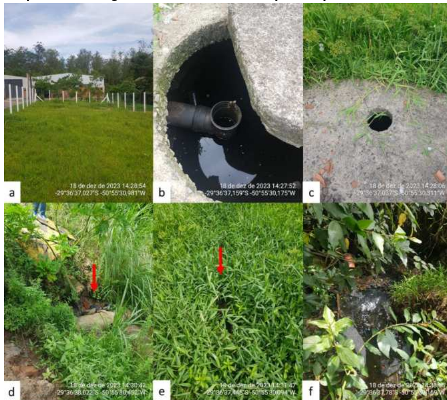
Figura 4 – Registro fotográfico da ETE da Av. Dr. Maurício Barani. a) Vista frontal da unidade; b) Vista do esgoto dentro da unidade; c) Vista de furo em na parte superior da unidade d) Vista do emissário do efluente da unidade; e) Vista de local com vazamento de efluente diretamente no solo; f) Vista do ponto de chegada do emissário no corpo receptor.

A seguir, faz-se a verificação se o tratamento de esgoto realizado pelas ETE estava sendo realizados, conforme preconizado no projeto de engenharia. A figura 4 apresenta o registro fotográfico da ETE da Av. Dr. Maurício Barani.