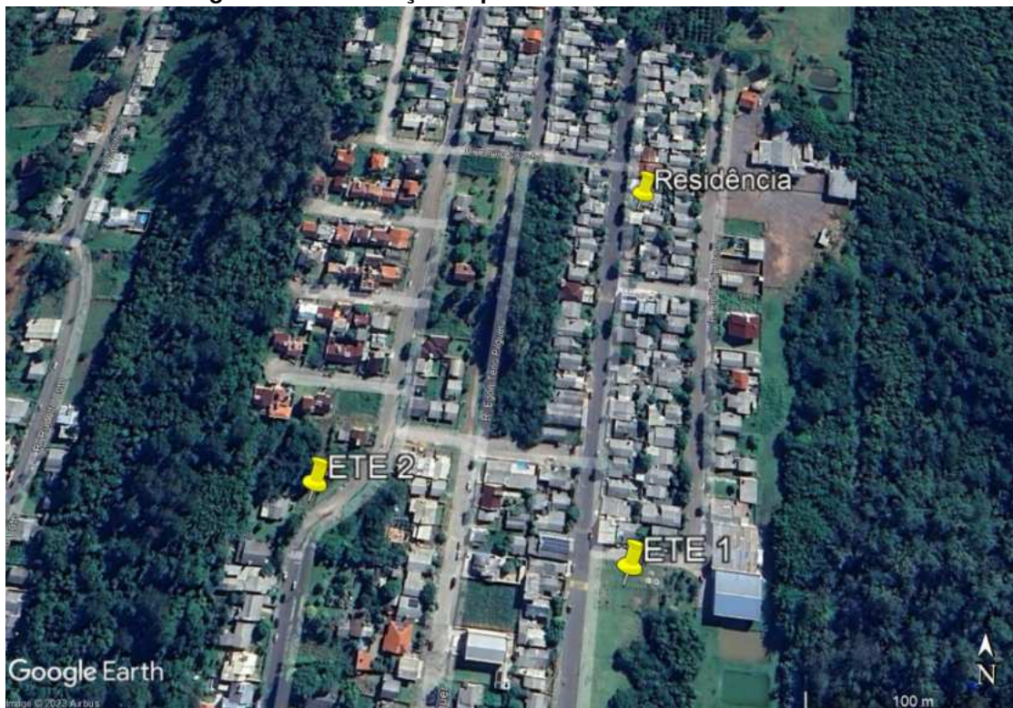
Figura 1 – Localização especial das ETE e da residência.

A seguir, faz-se a verificação da existência de coleta/afastamento de esgoto na residência. A figura 2 apresenta o registro fotográfico da residência.