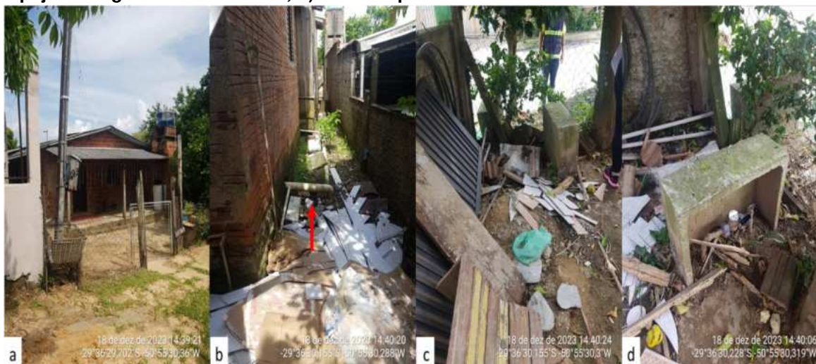
Figura 2 – Registro fotográfico da residência: a) Vista frontal da residência; b) Vista da tubulação de despejo da rede de esgoto predial; c) Vista da parte frontal do terreno onde a tubulação de despejo de esgoto está enterrada; d) Vista da parte frontal do terreno.

A seguir, faz-se a verificação da existência de coleta/afastamento de esgoto na residência. A figura 2 apresenta o registro fotográfico da residência.