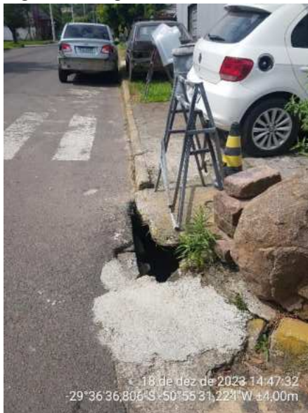
Figura 3 – Registro fotográfico da Av Dr. Maurício Barani.

Quanto à existência de ligações domiciliares na rede de esgotamento sanitário, em resposta à ouvidoria da Agesan-RS, a prestadora de serviço da Araricá Saneamento informou que seria necessário realizar um teste de fumaça/corante para identificar o fluxo da rede esgotamento sanitário, bem como os usuários que estão conectados nesta. No entanto, como não há caixa de calçada e nem mesmo poço de visita da rede de esgotamento sanitário, será necessária a realização de obras na rede para poder analisar o fluxo do esgoto doméstico, por isso foi solicitado um prazo de 30 dias pela prestadora para execução deste.