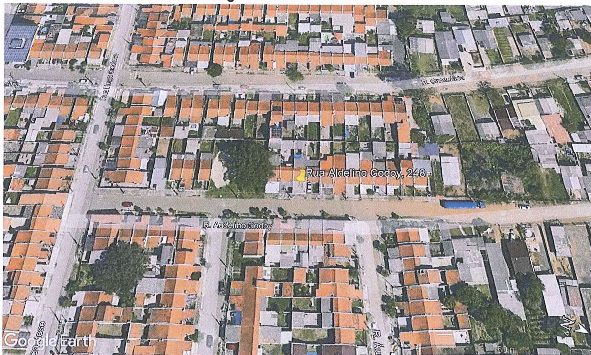
Figura 1 –Ponto fiscalizado.