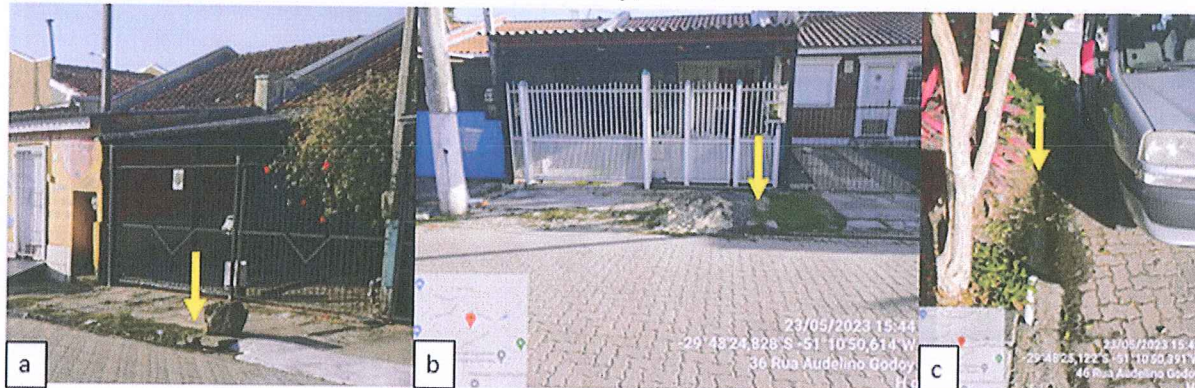
Figura 2 – Registros fotográficos: a) Tubulação que interliga a rede domiciliar à rede de esgotamento sanitário; b) Tubulação que interliga a rede domiciliar à rede de esgotamento sanitário; c) Esgoto in natura em frente à residência da rua Audelino Godoy, n. 248.