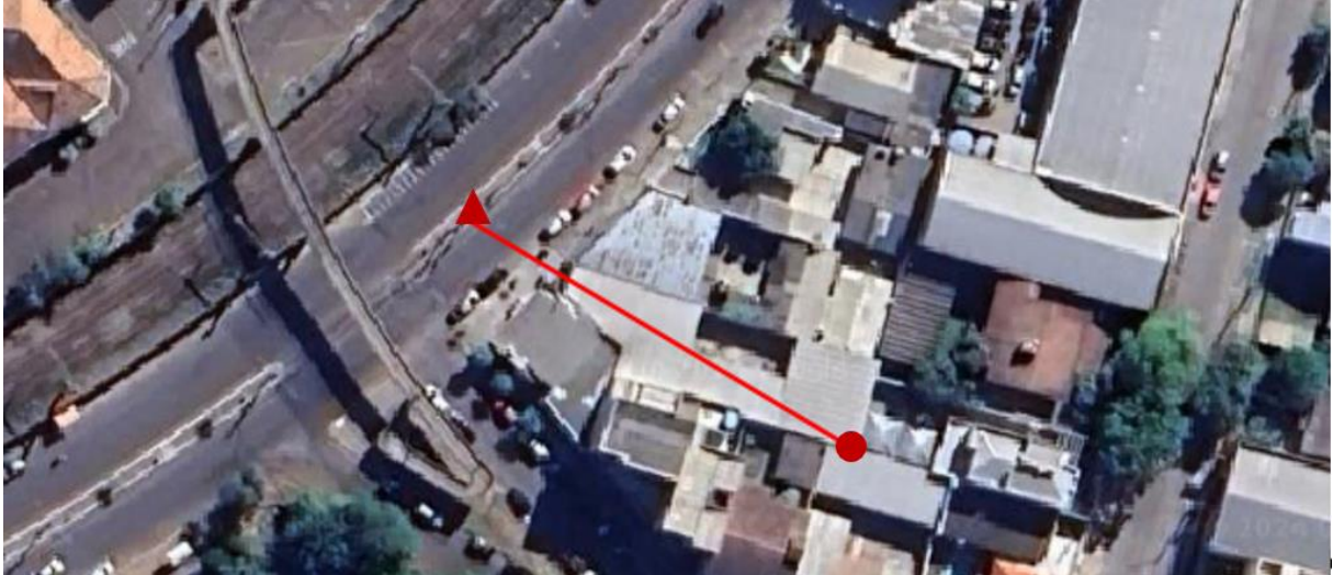
Figura 3 – Perfil de elevação iniciando nos fundos do terreno (círculo) até o eixo da via (triângulo).

análise do perfil, observa-se um desnível de aproximadamente 3 metros entre o fundo do terreno da residência e o eixo da via, como pode ser observado na Figura 3.