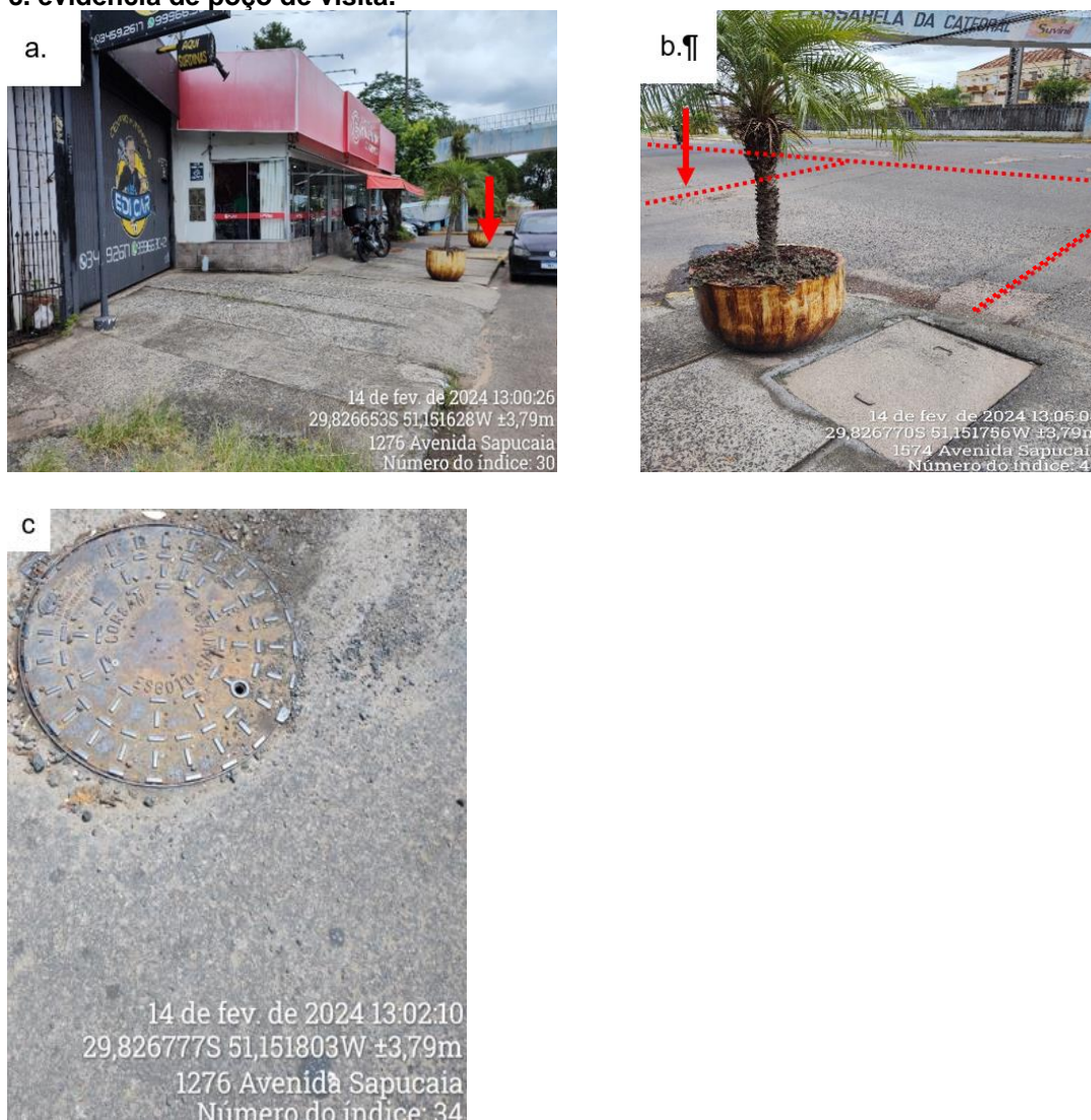
Figura 2 – Registro fotográfico a. Vista geral do imóvel com o posicionamento da caixa de ligação próxima ao imóvel; b. Vista da caixa de ligação evidências e destaque de evidência de rede de coleta de esgoto sanitário (linha vermelha tracejada) e poço de visita (seta em vermelho); c. evidência de poço de visita.

No escritório, a fim de verificar a declividade do terreno em relação à via pública, foi obtido o perfil de elevação do terreno através de imagem de satélite. Através da