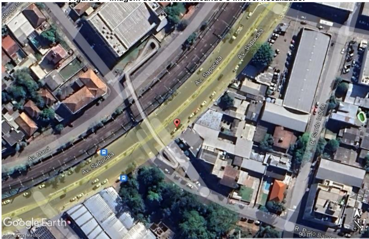
Figura 1 – Imagem de satélite indicando o imóvel fiscalizado.