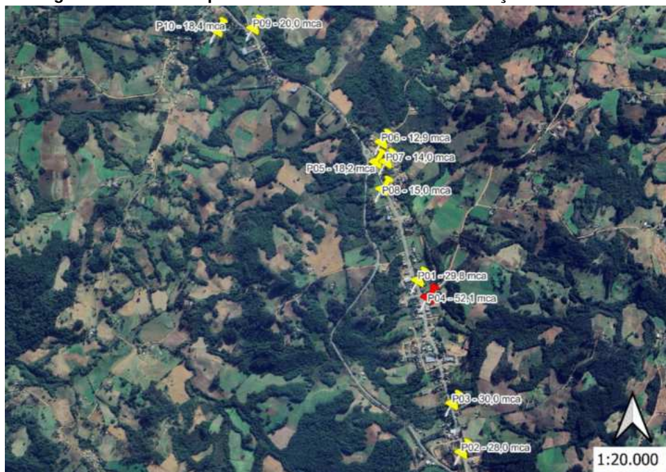
Figura 1 – Pontos de pressão aferidos na rede de distribuição em Chuvisca.