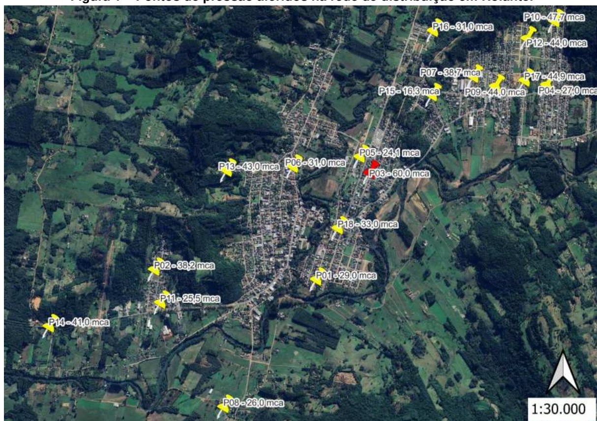
Figura 1 – Pontos de pressão aferidos na rede de distribuição em Rolante.