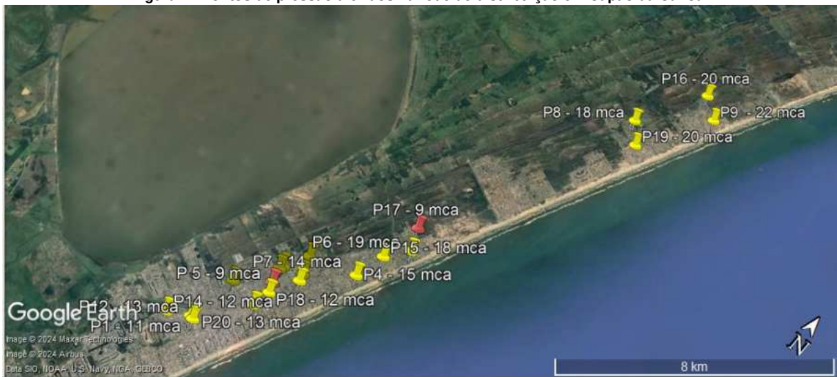
Figura 1 –Pontos de pressão aferidos na rede de distribuição em Capão da Canoa.