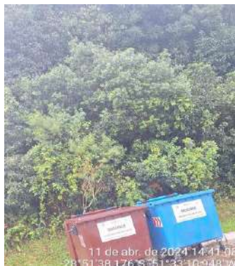
Figura 01: Contentores coletivos de resíduos sólidos no município de Vila Flores.

A coleta de resíduos sólidos orgânicos é feita por meio de um veículo transportador compactador com sistema Lifter , o qual possui carregamento traseiro para a execução da atividade. O mesmo se dá com a coleta de resíduos sólidos urbanos domiciliares seletivos. Os veículos utilizados nas coletas de ambas as tipologias de RSU possuem capacidade de armazenamento de 8 m 3 .