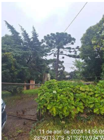
Figura 2: Identificação da área de descarte de podas municipal.

A Administração Municipal possui uma área destinada a receber o descarte de resíduos de podas. Este localiza-se nas coordenadas geográficas: 28°50'13,7"S 51°32'19,98"O. A figura 2 identifica a unidade: