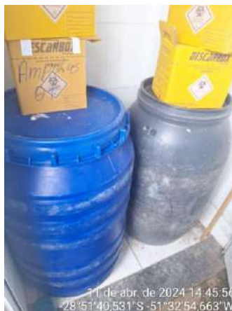
Figura 3: Armazenamento temporário de RSS em Vila Flores/RS.

O armazenamento de RSS no município é na Unidade Básica de Saúde de Vila Flores, a qual localiza-se na R. Dez de Abril, n. 530.