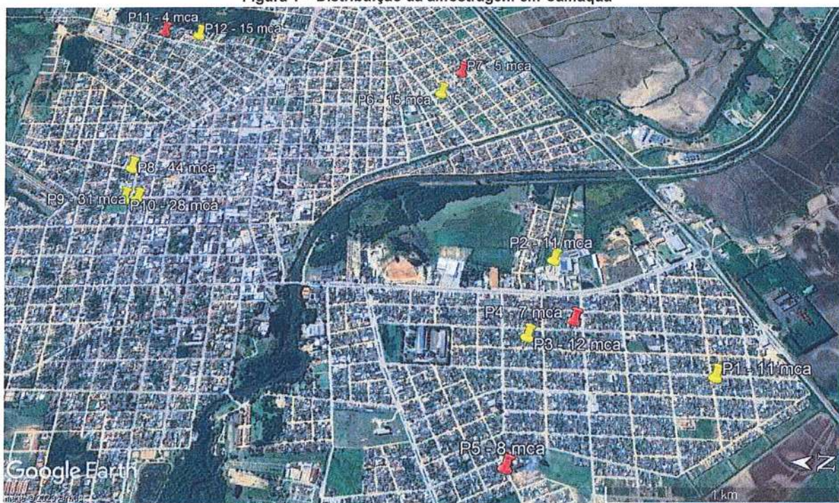
Figura 1 – Distribuição da amostragem em Camaquã