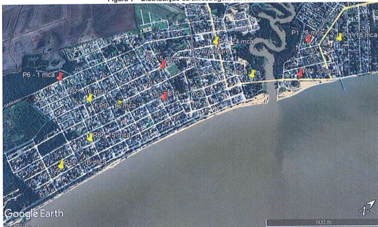
Figura 1 – Distribuição da amostragem em Arambaré