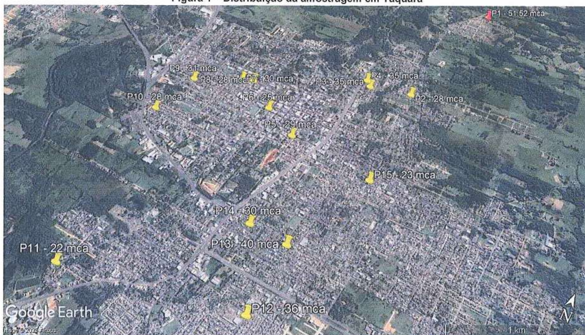
Figura 1 – Distribuição da amostragem em Taquara