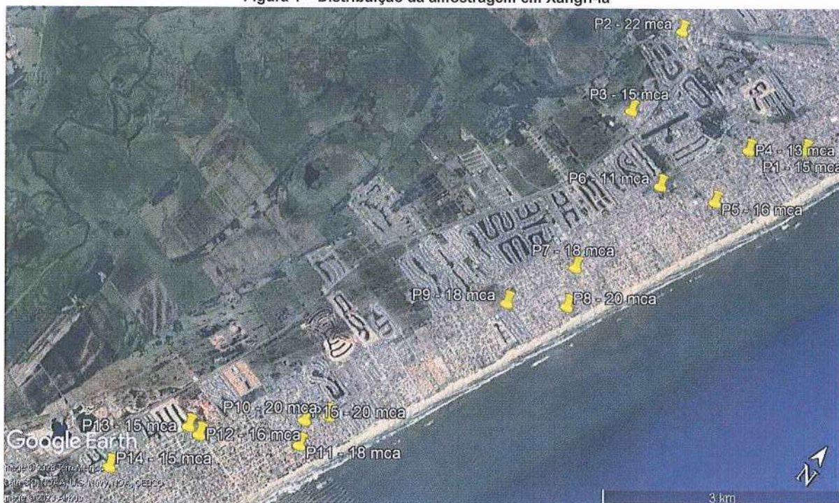
Figura 1 – Distribuição da amostragem em Xangri-lá

Média 16,8 Desvio Padrão 3,0 Precisão 1,5 Nível de Confiança 95%