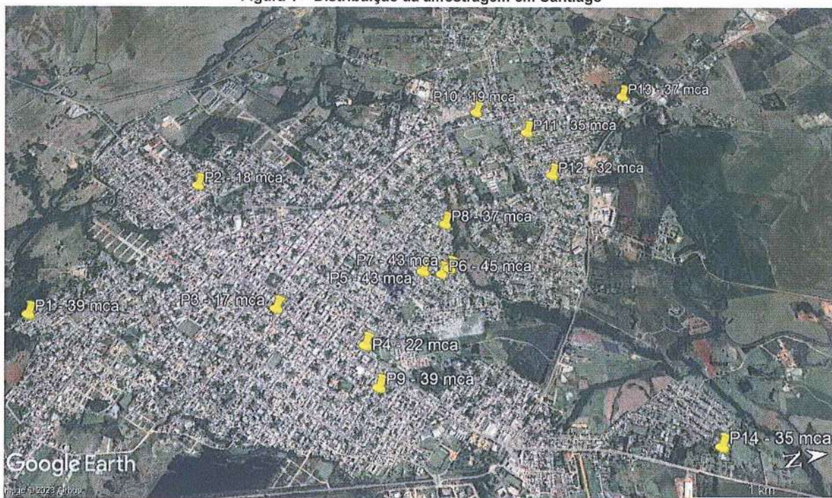
Figura 1 – Distribuição da amostragem em Santiago