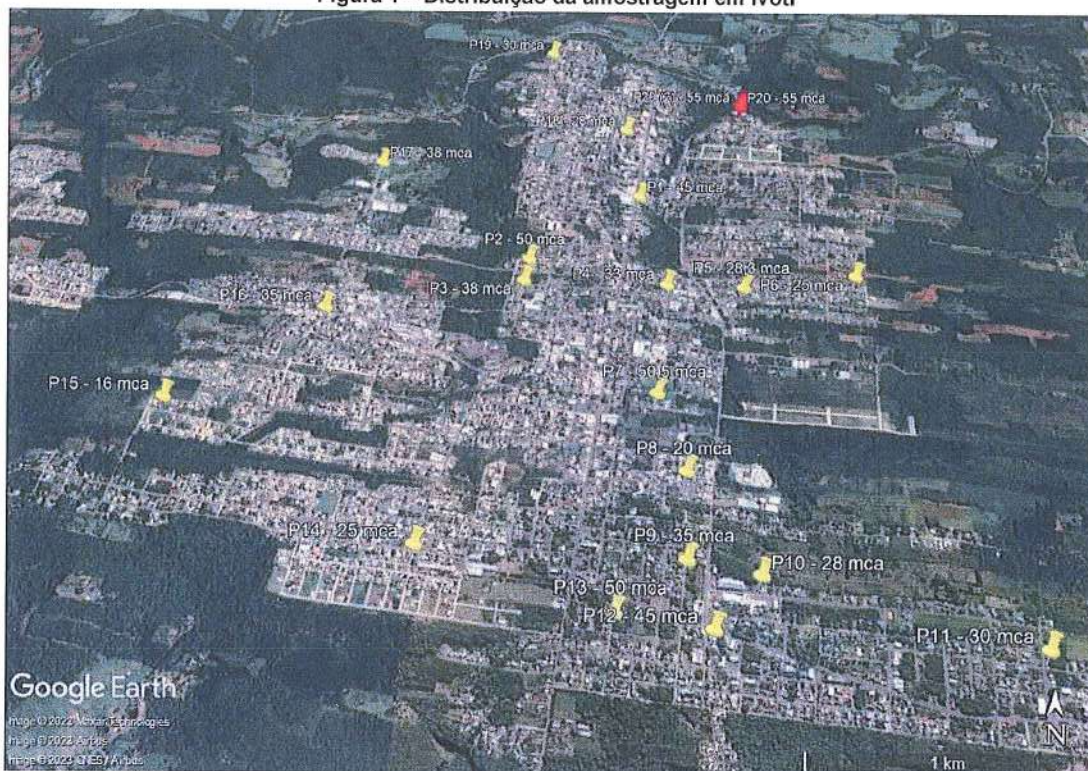
Figura 1 – Distribuição da amostragem em Ivoti