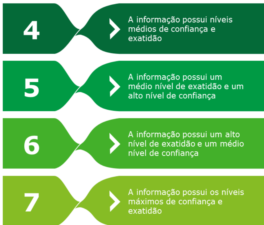
Figura 3 – Descrição das certificações atribuíveis às informações do SNIS