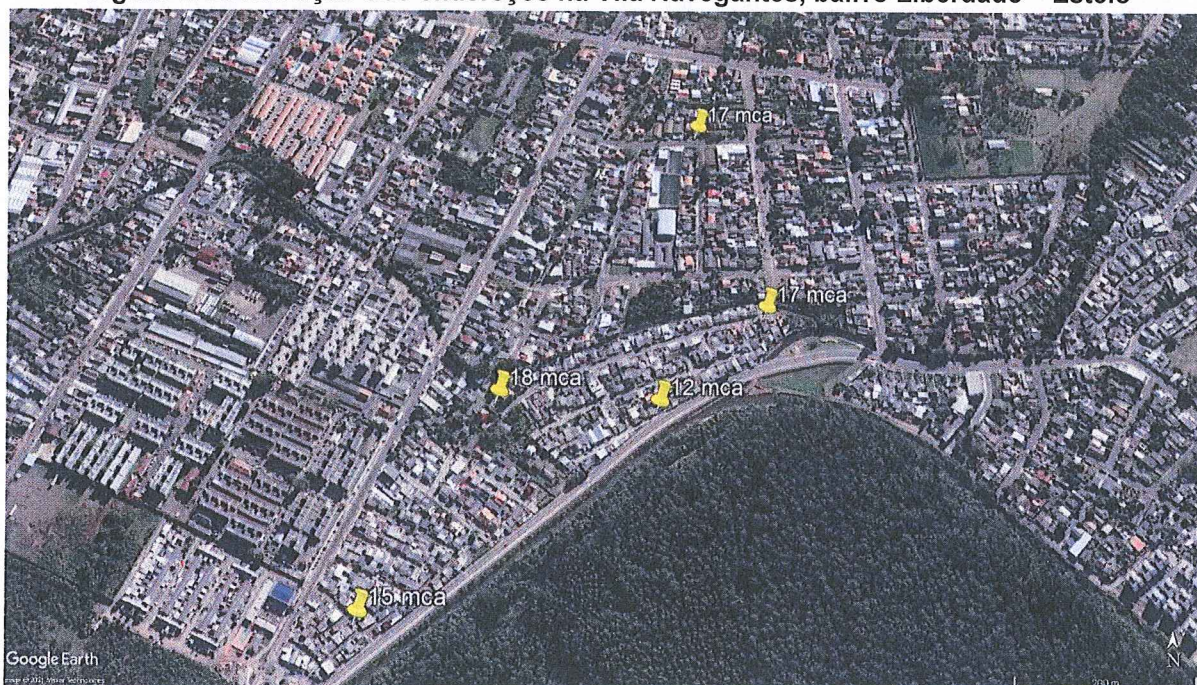
Figura 1: Localização dos endereços na Vila Navegantes, bairro Liberdade – Esteio

b) A média aritmética da pressão nos endereços fiscalizados ficou em 15,8 mca com desvio padrão de 2,1 mca. O limite mínimo estabelecido no Regulamento de Serviços de Água e Esgoto da Corsan é de 10 mca;