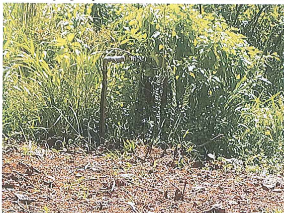
Figura 1: Registro fotográfico do poço que abastece a localidade no município de Nova Hartz/RS

b) Na figura 2 pode-se observar a localização dos 6 pontos em que foram aferidas as pressões, bem como do sistema de abastecimento de água da comunidade, que é composto por poço e reservatório. Na tabela 1, estão dispostas as informações dos pontos, em que foram realizadas as medições de pressões, sendo que os locais foram definidos pelo colaborador da autarquia Águas de Nascente.