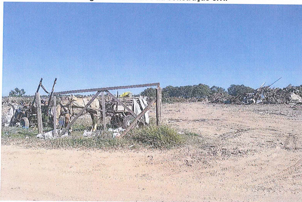
Figura 7: Resíduos da construção civil

(Coordenadas geográficas 29°59'33.18"S 50°12'5.83"W)