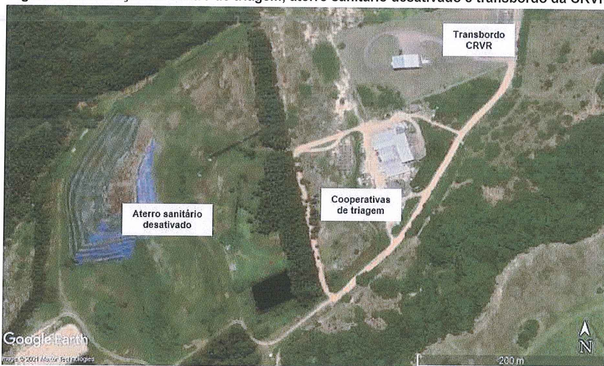
Figura 1: Localização do centro de triagem, aterro sanitário desativado e transbordo da CRVR.

Fonte: Google Earth (Coordenadas geográficas 29°59'47.48"S 50°12'14.48"W)