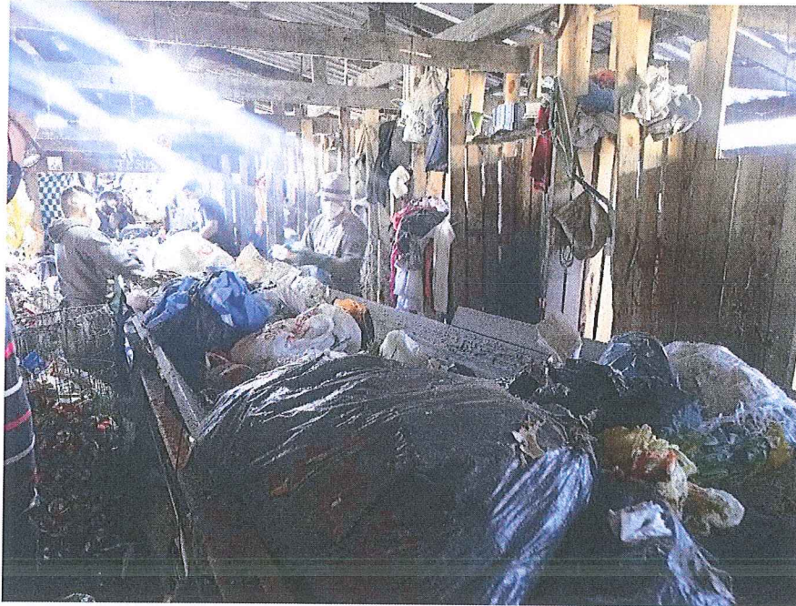
Figura 4: Triagem

d) Caminhão (figura 5) pertencente às cooperativas que leva os rejeitos para o transbordo da empresa CRVR (figura 6);