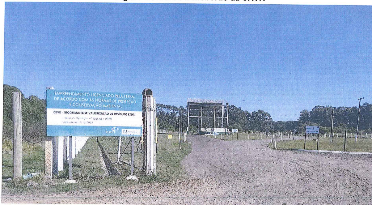
Figura 6: Área de transbordo da CRVR

h) A equipe da Agesan-RS também visitou o local onde são descartados os resíduos volumosos e da construção civil de Tramandaí (figura 7), localizado ao lado do transbordo da empresa CRVR.