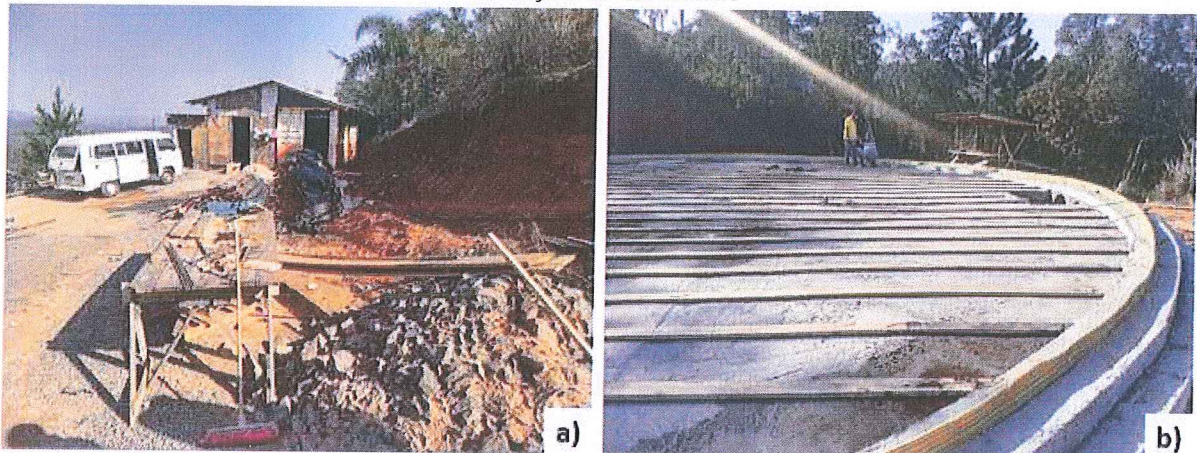
Figura 2: Registros fotográficos da visita à construção do reservatório em 2021. a) Vista do canteiro de obras; b) fundações do reservatório