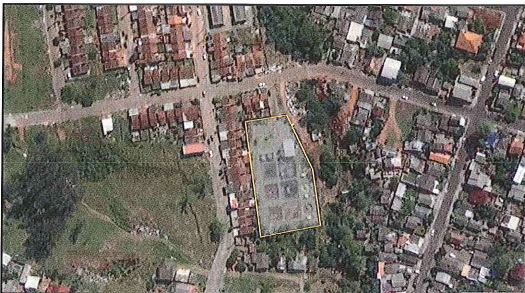
Figura 1: Localização espacial da ETE Parque Residencial Novo Hamburgo, coordenadas 29°40'36S e 51°10'19"W.

O tratamento de esgoto sanitário é constituído por uma elevatória com gradeamento, um sistema de gradeador, desarenador e calha Parshal, três reatores anóxicos, três reatores aerados, três decantadores secundários, dois adensadores de lodo e um filtro prensa.